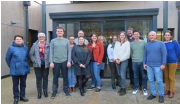
Une partie de l'équipe de la MSP, aux côtés d'élus de la Communauté de communes Thoré Montagne Noire et de Labastide-Rouairoux.