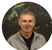
ALAIN AMALRIC Rouairoux