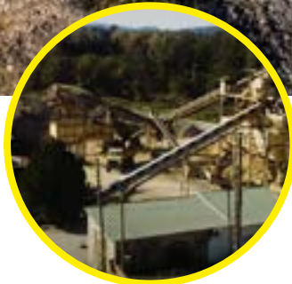
Économie, Tourisme Urbanisme & Habitat