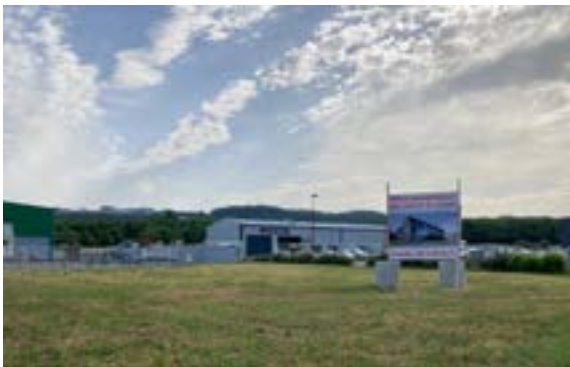
Zone d'activité économique de la Lauze à Bout du Pont de l'Arn

Une zone d'activité économique est un site réservé à l'implantation d'entreprises. Depuis le 1 er janvier 2023, la gestion des zones d'activité économique relève de la compétence de la CCTMN. Elles sont donc désormais définies, aménagées et gérées par la Communauté de communes. Par délégation, les communes continuent d'effectuer l'entretien courant.