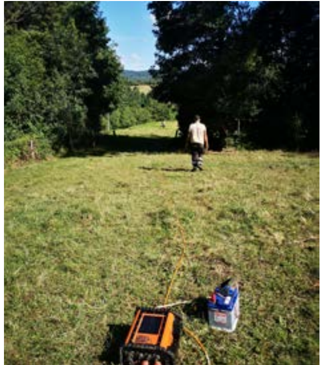
Réalisation de l'étude géophysique, août 2023

Cela a mené à l'identification de deux secteurs, l'un sur Albine, l'autre sur Lacabarède. La prochaine étape est d'y réaliser des essais de forages pour estimer la quantité d'eau présente dans les sous-sols (à environ 100 m de profondeur). Ces forages d'essai seront réalisés durant l'année 2024.