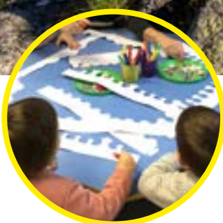
Social, Santé Petite enfance